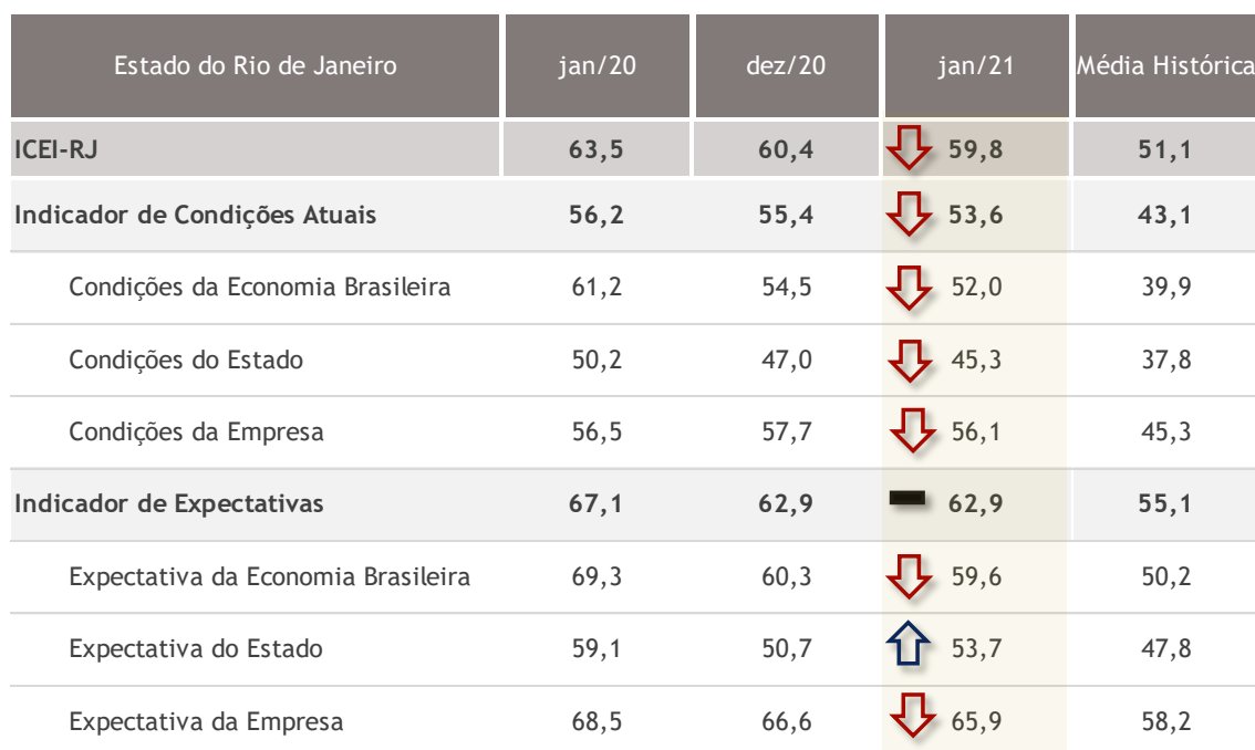
Tabela 1- ICEI-RJ e seus componentes

Apesar leve baixa no mês de janeiro, o indicador de confiança ainda continua no campo otimista. O ambiente de incerteza com o avanço dos casos no Brasil e no mundo, aliada às novas medidas de isolamento social em diversas partes do país leva os empresários industriais fluminenses a ficarem um pouco mais céticos com relação, principalmente, às condições atuais. No entanto, para os próximos meses, em especial, com a chegada da vacina, registram perspectivas positivas, visando a vacinação em massa, redução dos casos, retomada das atividades econômicas e estímulo ao aumento de produção.