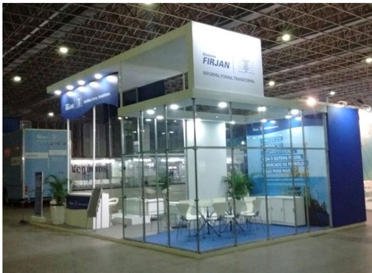
Estande do Sistema FIRJAN na OTC Brasil 2017

Como qualquer maratona, o início da corrida precisa de um ritmo constante porém não exaustivo, no intuito de preservar energia para completar a prova. O mercado de petróleo e gás no Brasil experimenta uma relargada. Entre a 14ª Rodada de Licitação e as duas do pré-sal, ocorre a OTC Brasil, desta vez em conjunto com a Rio Pipeline, dois eventos importantes do calendário, ambos organizados pelo Instituto Brasileiro de Petróleo, Gás e Biocombustíveis - IBP.