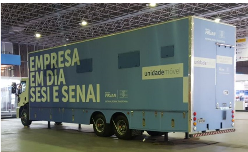
Unidade móvel do Sistema FIRJAN na OTC Brasil 2017