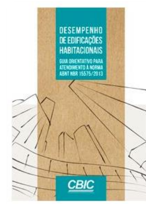
Desempenho de Edificações Habitacionais Guia Orientativo para Atendimento à Norma ABNT NBR 15575:2013 (CBIC)