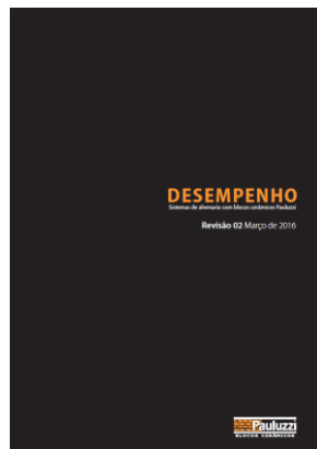
Sistemas de Alvenaria com Blocos Cerâmicos Pauluzzi (Pauluzzi)