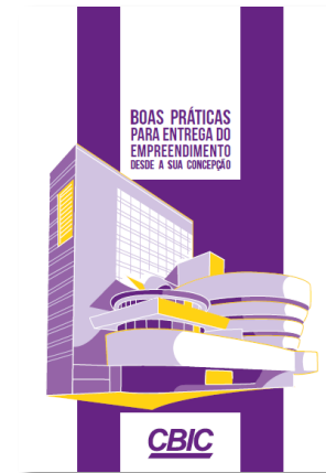
Boas Práticas para Entrega do Empreendimento Desde a sua Concepção (CBIC)