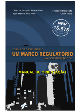
Norma de Desempenho – Um Marco Regulatório na Construção Civil : Manual de Orientação