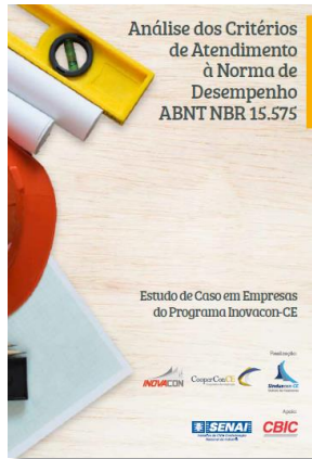
Análise dos Critérios de Atendimento à Norma de Desempenho ABNT NBR 15.575 (CBIC)