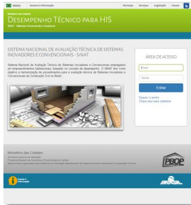
Desempenho Técnico para HIS* (Ministério das Cidades)