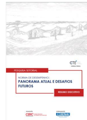
Norma de Desempenho - Panorama Atual e Desafios Futuros (CBIC)