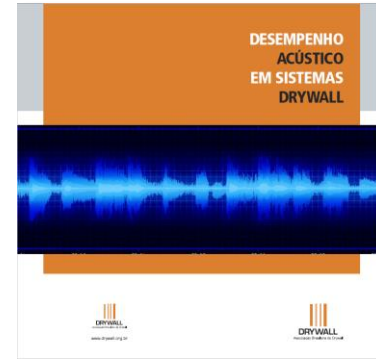
Desempenho Acústico em Sistemas de Drywall (Associação Brasileira de Drywall)