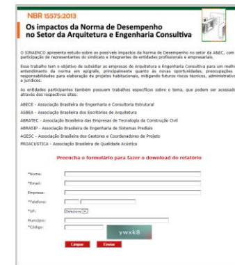
Recomendação Técnica NBR 15575:2013 (SINAENCO)