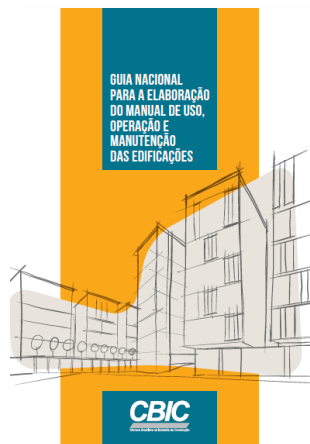
Guia Nacional para a Elaboração do Manual de Uso, Operação e Manutenção das Edificações (CBIC)