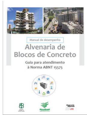
Manual de Desempenho Alvenaria de Blocos de Concreto (Bloco Brasil)