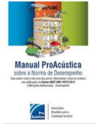
Manual ProAcústica sobre a Norma de Desempenho – 2ª Edição (ProAcústica)