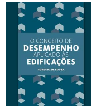
O Conceito de Desempenho Aplicados às Edificações* (CTE)