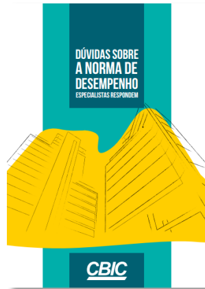
Dúvidas sobre a Norma de Desempenho (CBIC)