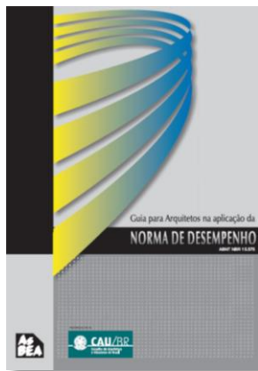
Guia para Arquitetos na Aplicação da Norma de Desempenho (ASBEA)