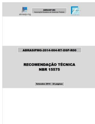
Recomendação Técnica NBR 15575:2013 (ABRASIP MG)