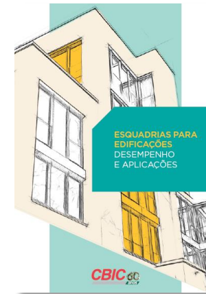
Esquadrias para Edificações / Desempenho e Aplicações (CBIC)