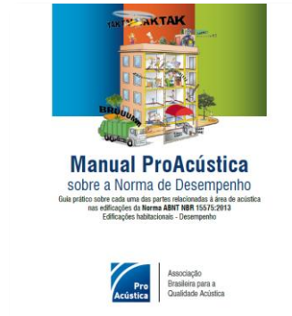
Manual ProAcústica sobre a Norma de Desempenho (ProAcústica)