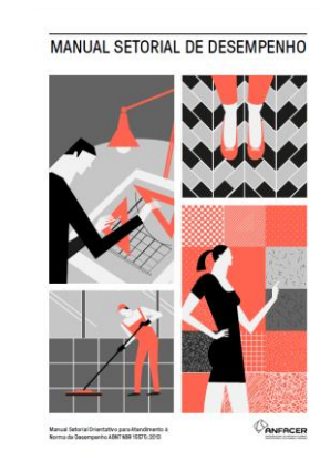
Manual Setorial de Desempenho (ANFACER)