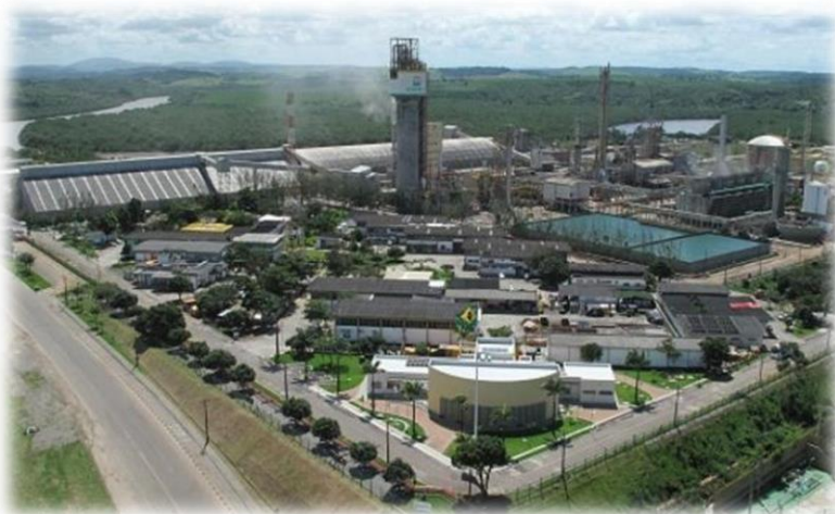
Fábrica de Fertilizantes Nitrogenados - FAFEN (SE)