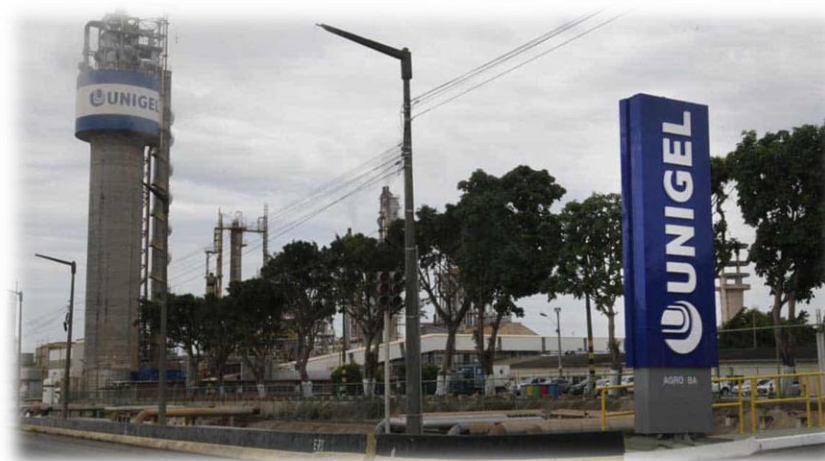
Unigel Agro Bahia, antiga FAFEN-BA