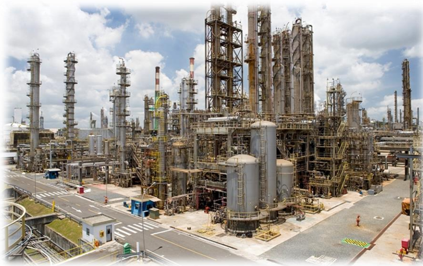
Complexo Industrial Gás-Químico de Duque de Caxias (RJ)