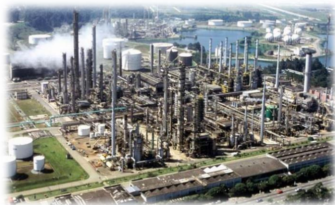
Polo Petroquímico de Capuava (SP)