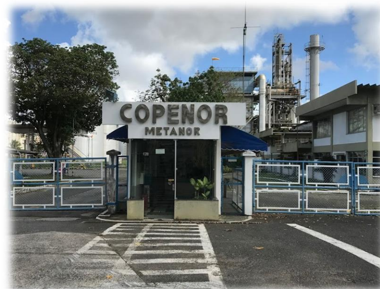
Instalações da Copenor (BA)