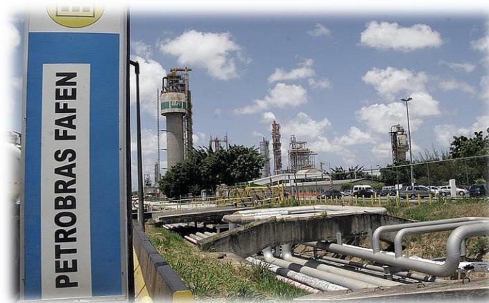
Fábrica de Fertilizantes Nitrogenados - FAFEN (BA)