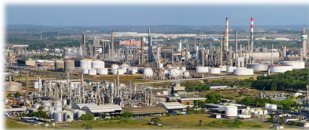
Polo Petroquímico de Camaçari (BA)