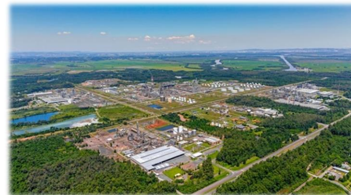
Polo Petroquímico de Triunfo (RS)