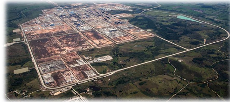
Região do Polo GasLub de Itaboraí (RJ) – Antigo Comperj