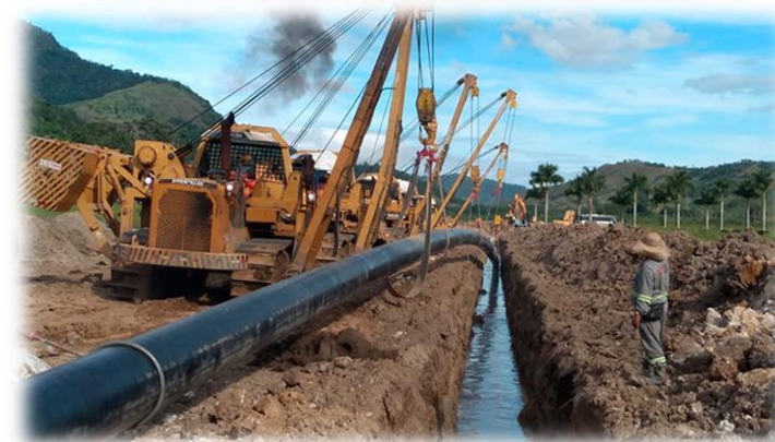
Construção do Gasoduto Rota 3

Gasodutos partindo do Pré-Sal até a Costa do Sudeste