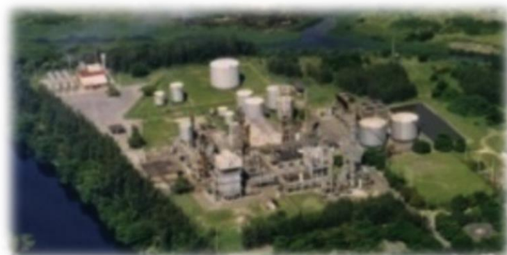
Antiga Planta Industrial da Prosint (RJ)